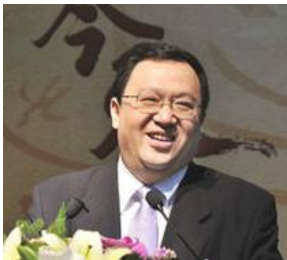
(2016年03月18日作为嘉宾做演讲，资料照片)